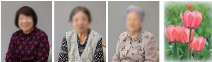
N.K 様 N.K 様 E.H 様